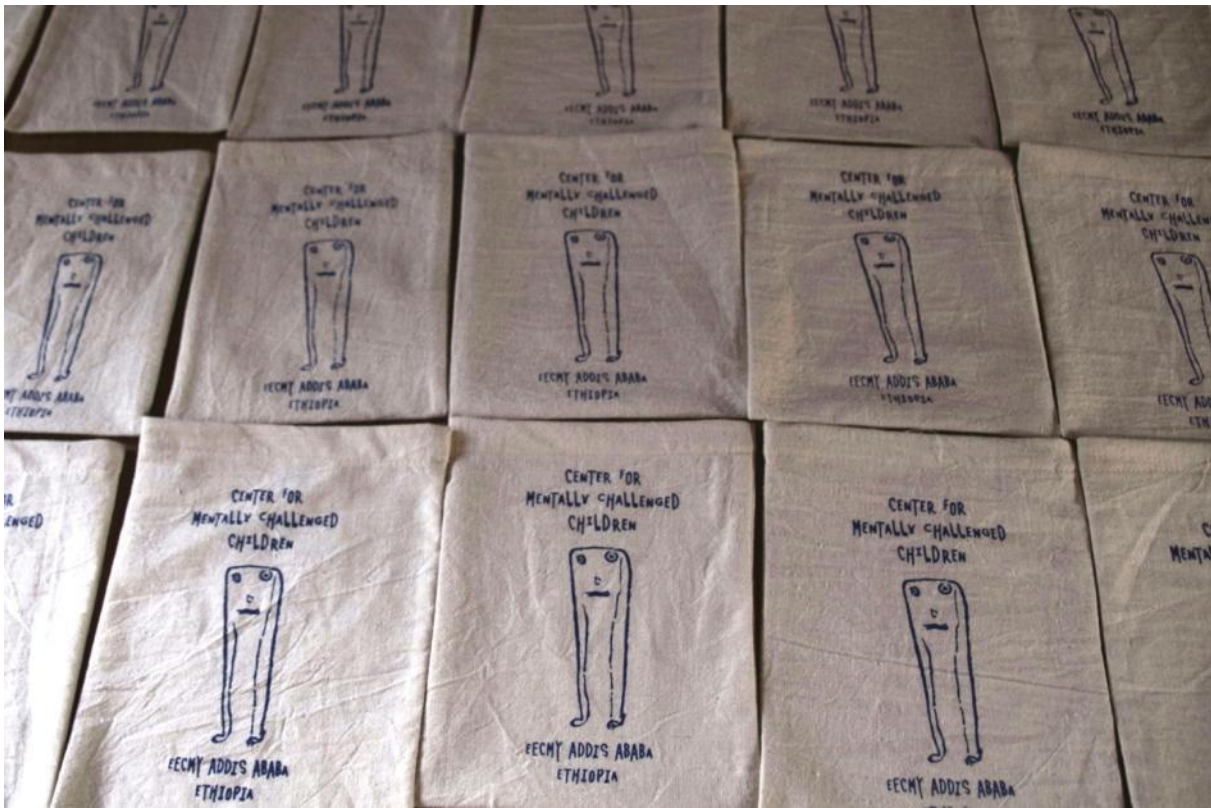
Die Schüler – Die Schule