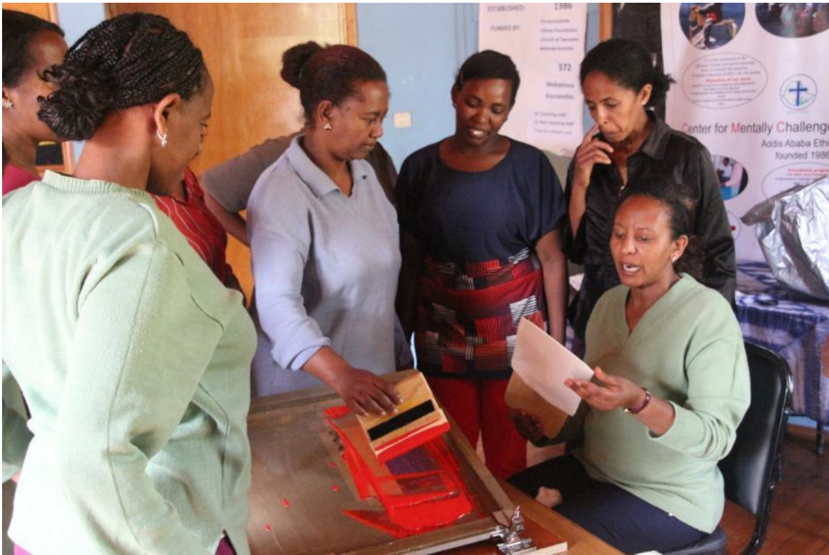
Farbwechsel und kleinere Taschen...