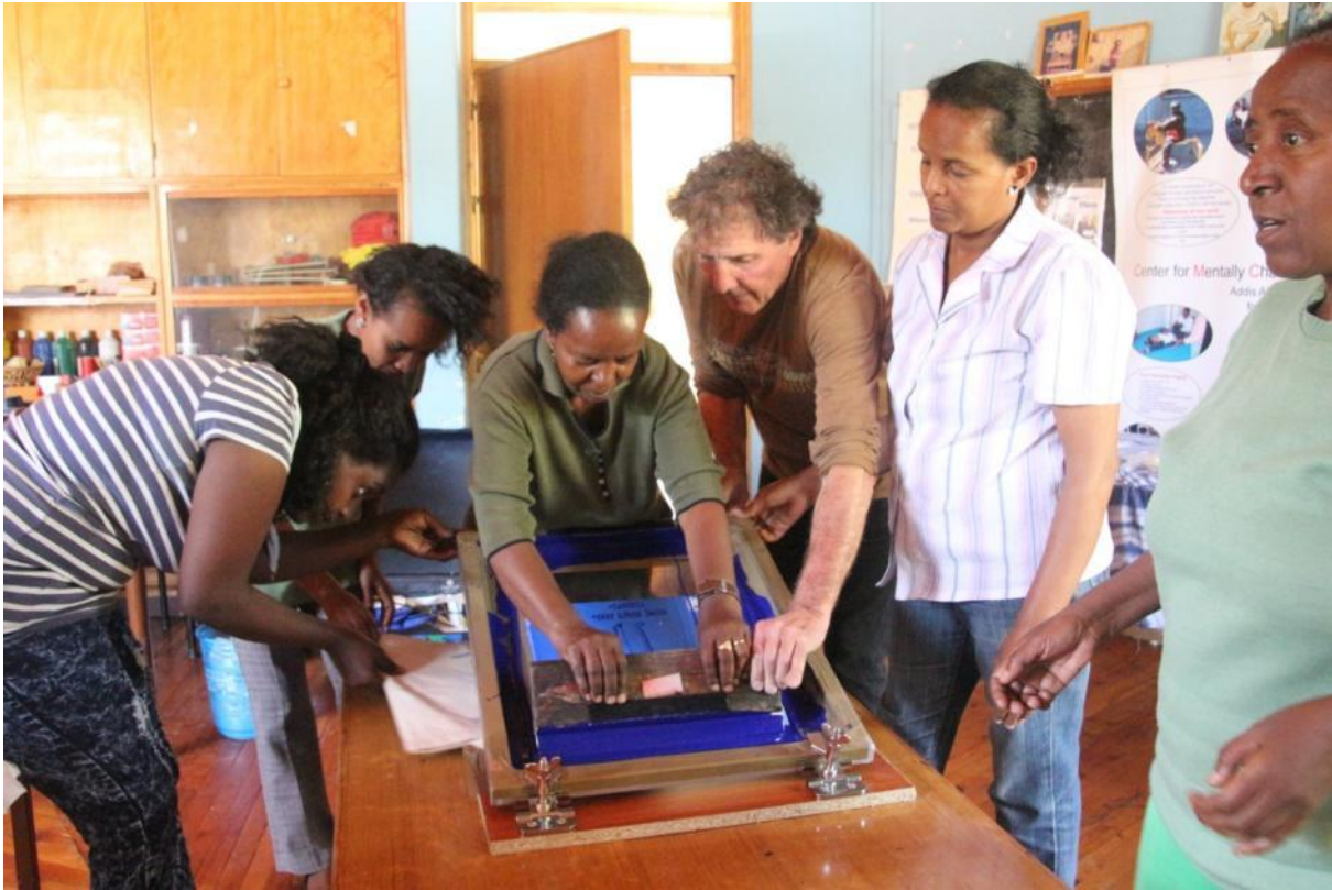
die ersten Taschen werden bedruckt....